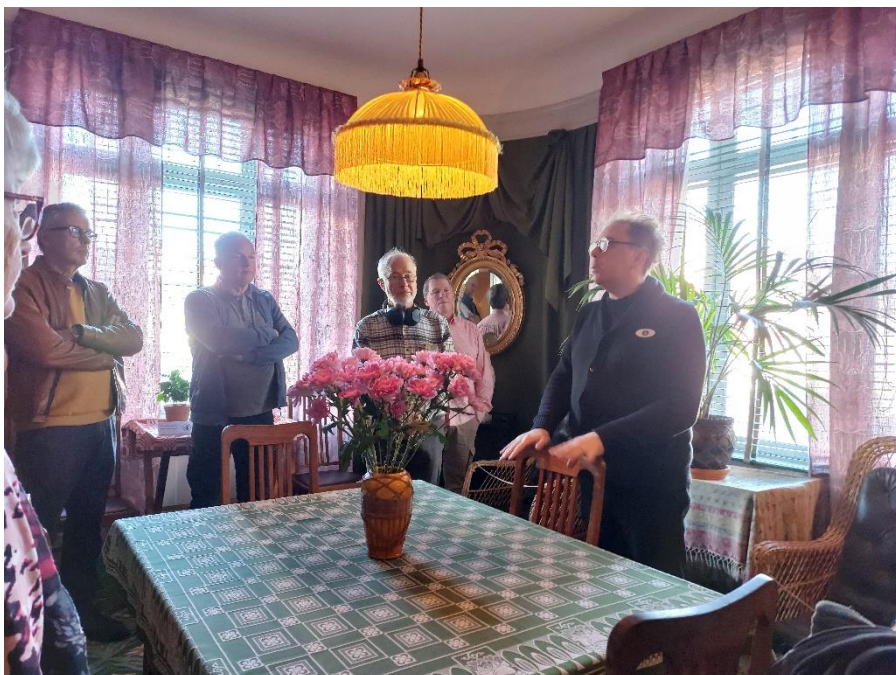
Salongen och bordet där Strindberg bjöd samtida kulturpersoner på middag.

Vi fick en visning av våningen med sovrum, salong och arbetsrum och slutligen biblioteket två trappor upp på vinden. Därefter fanns det tid för att själv titta på de utställningar som finns på museet.