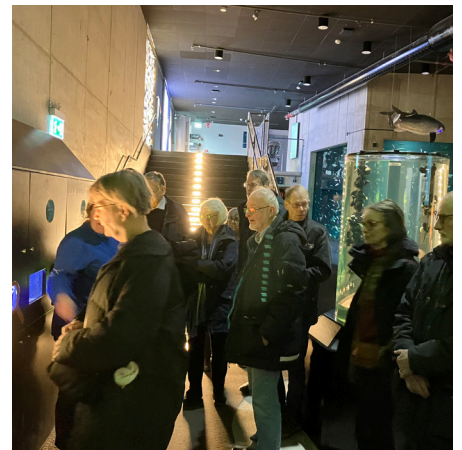
FRÅN VÅRT BESÖK

Vi var 14 veteraner som besökte Baltic Sea Science Center, på Skansen.