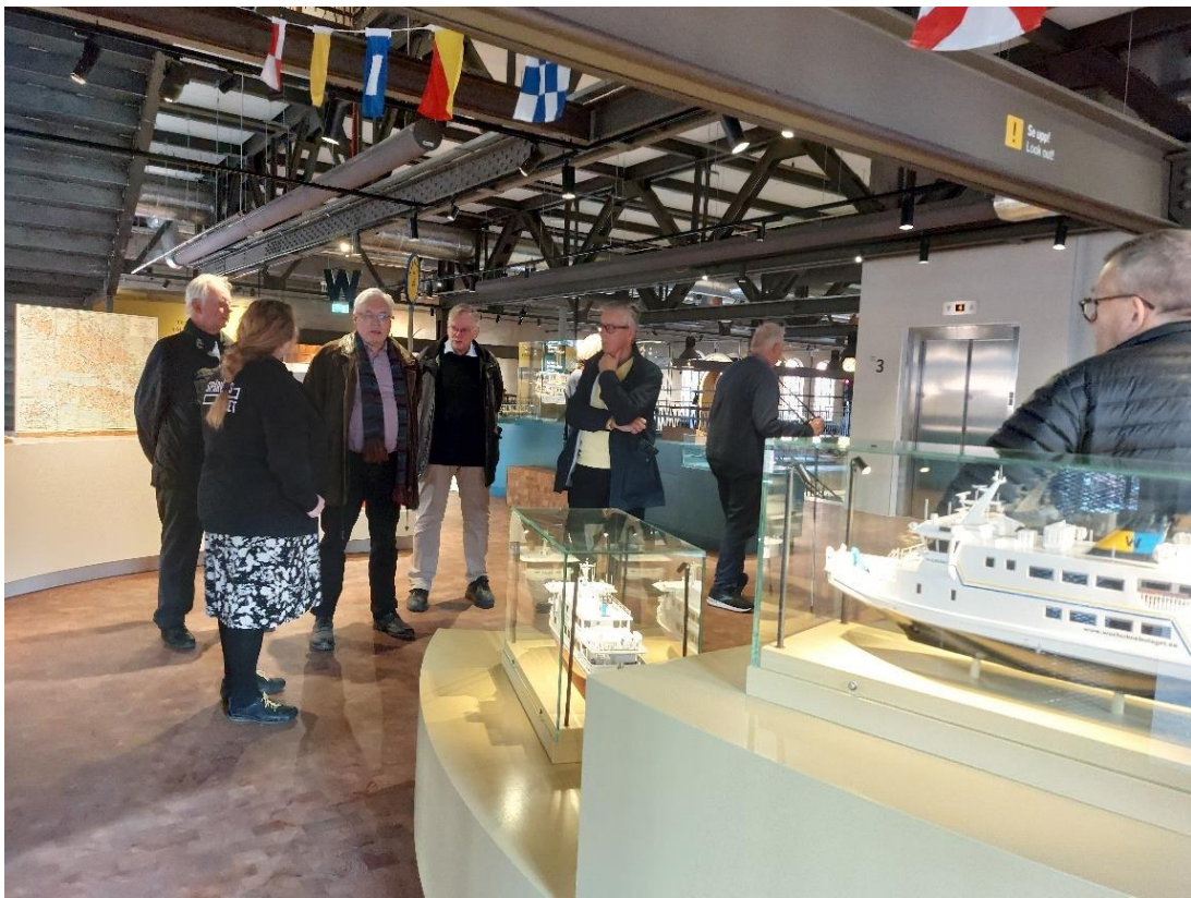
Text och foto: Inger Norberg